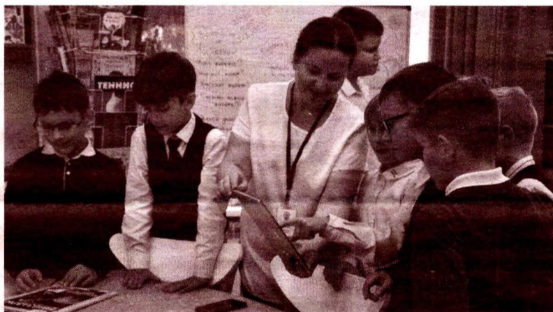
В библиотеке ребята могут не только почитать книги, но и отдохнуть, познавательно и увлекательно провести свободное время

«Вспоминаю библиотеку своего детства, что находилась в деревянном двухэтажном здании, куда мы ходили за дополнительными знаниями, добывая их лишь из книг. И прожужжал параллель с совре-